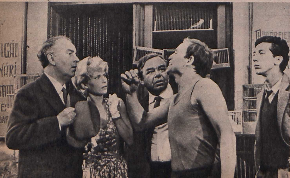
Jelenet a filmből

Nevetni emberi vonás. Önmagun- kon nevetni az erő jele. Csak a bi- zonytalan ember képtelen önmaga kigúnyolására és lobogtatja kis ere- nyeit és takargatja-leplezgeti kelle- metlen tulajdonságait. És a nemzeti önillúziónyomatok nélkülöznek min- den humort és iróniát. Rákönnyez- nek a rosszul értelmezett nemzeti nagyságra. Miközben a zálogház felé viszik a nagypapa aranyozott ezüst zsebóráját, arra gondolnak, hogy