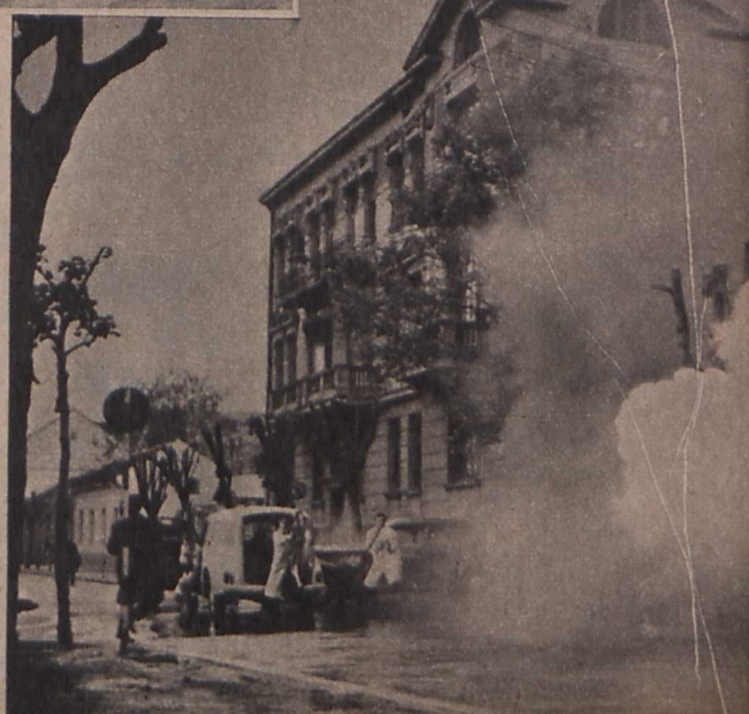
Vladimir Pogacic: »Ember a fényképről«

E film jelentősége, rendkívüli sikerének titka abban áll, hogy jugoszláv filmen első ízben ábrázolták igazán művészen és drámailan vezetői hibáit, s az így kialakult helyzet hatá-