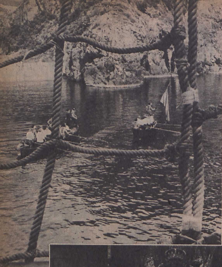
Jelenet a »Hét tenger ördöge« című filmből

s mérhetetlenül üres sztorinak eljuttassák marionette-figuráit. Ugyancsak temérdek kaland jellemzi »Az én hajóm hozzád vezet« című filmet, amely tipikus amerikai tengerész vígjáték.