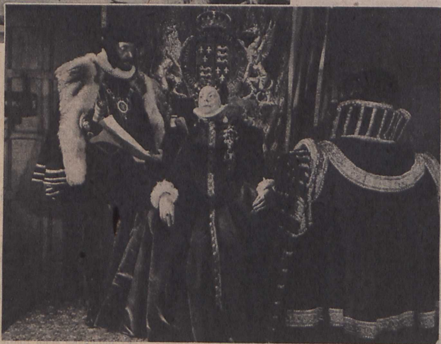
Irene Worth a királynő szerepében (Hét tenger ördöge)