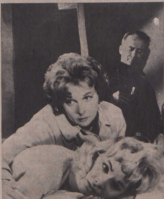
Susan Hayward és Diane Cilento (A zöld orvosság titka)

tornő bűnperével indul. A fiatal orvosnőt, akit Susan Hayward alakít, azzal vádolják, hogy gyógyíthatatlanul beteg szerelmesének olyan adag morfiumot adott, hogy az belehalt. Elítélik, s a büntetés kitöltése után az orvosnő ápolónői állást vállal — és éppen volt ügyészénél! (Peter Finch alakítja.) Egymást kergetik a különös és megmagyarázhatatlan cselekmények, míg az ügyész felesége meghal, mert Christine állítólag túl sok nyugtatót adott neki... Végül tisztázódik az orvosnő ártatlansága sincs, de a cselekmény-