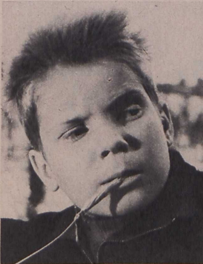
A »Kalózok a lovak szigetén« két főszereplője

farkas«, a »Hófehérke«, a »Holle anyó«. Végeztül az úttörők és iskolások életével foglalkoznak, mint a »Kalózok a lovak szigetén« című film, amely egy úttörőcsapat nyári kalandjairól szól egy védett területén, vagy a »Ripők« című filmalkotás, amely két fiú és egy kutya barátságáról szól. E. S.