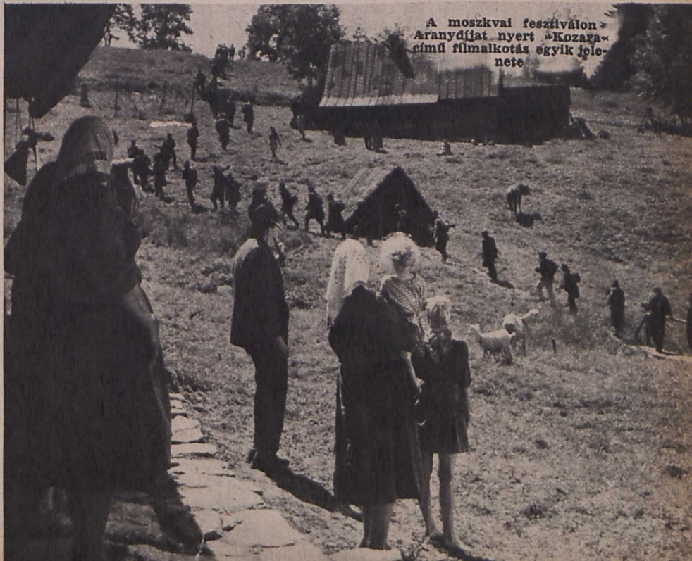
A moszkvai fesztiválon Aranydíjat nyert »Kozara« című filmalkotás egyik jelenete

Az idei, jubileumi fesztivál nyitányán is felhangzott az ágyúdörög és a géppisztolyropogás, de meg kell mondanı, a különböző vélemények ellenére is, a belgrádi Avala produkciójában elsönek bemutatott film »A drvári támadás« osztatlan nagy közönségikert aratott nemcsak témája miatt, amely a jugoszláv népfelszabadító háború egyik legválságosabb pillanatát örökíti meg — német ejtóernyösök támadását a kisváros ellen, ahol ez idő tájt Titó is tartózkodott —, ha-