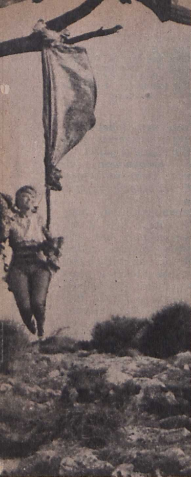
A vikingek idejébe vezet vissza a »Hosszú hajók« című jugoszláv–angol koprodukció