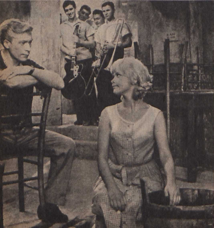
Bostjan Hladnik alkotása: a »Homokvár«

film, s az őszinteséget nem szabad merészség- nek nevezni. A »Szentől szembe« bebizonyítta — ahogy a jugoszláv kritikusok írják — »a mindennapi problé- mák kendőzetlen feltá- rásával lehet csak izgalmas, mai filmet csinálni«.