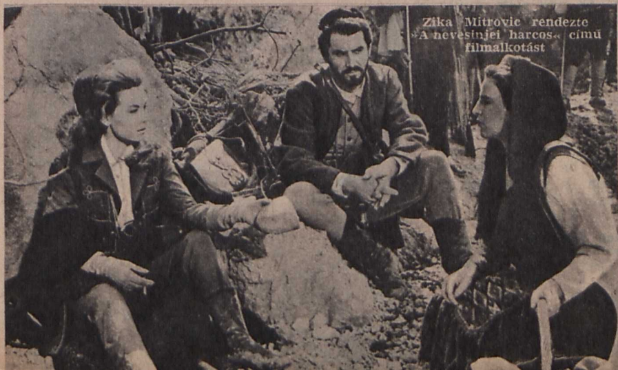
Zika Mitrović rendezte »A nevesinjei harcos« című filmalkotást

vita még a fesztivált követő hetekben is a jugoszláv sajtóban. Az Erena című filműjság kiemeli ezzel kapcsolatban; »A filmszemle el-