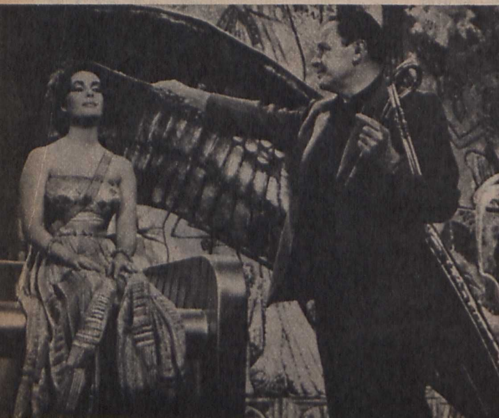
Joseph Mankiewicz, a film rendezője utasításokat ad Elisabeth Taylornak