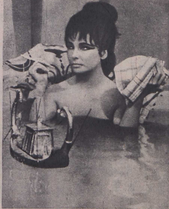
Cleopatra (Elisabeth Taylor) forgatás közben

Skouras valóban rosszul döntött. Heteken át az idő rossz volt. Aztán októberben Elisabeth Taylor megbetegedett — szenzációsan, hatásosan — és végül egész komolyan. Magára a felvételre pedig az volt jellemző, hogy — mint Mamoulin nyilatkozta — »Valahányszor csak valaki kimondott egy szót, látni lehetett a leheletét. Ez nem Egyiptom volt, hanem az Északi Sark. Bárgyú gondolat volt az egész.«