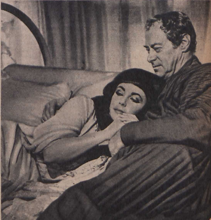
Cleopatra (Elisabeth Taylor) és Caesar (Rex Harrison)