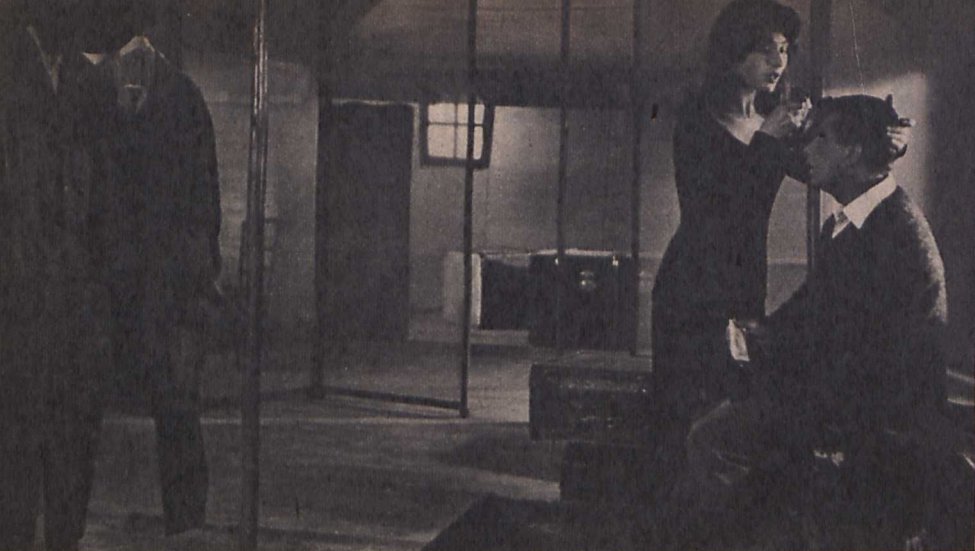
Jelenet Jasny: »Amikor a macska jön« című filmjéből