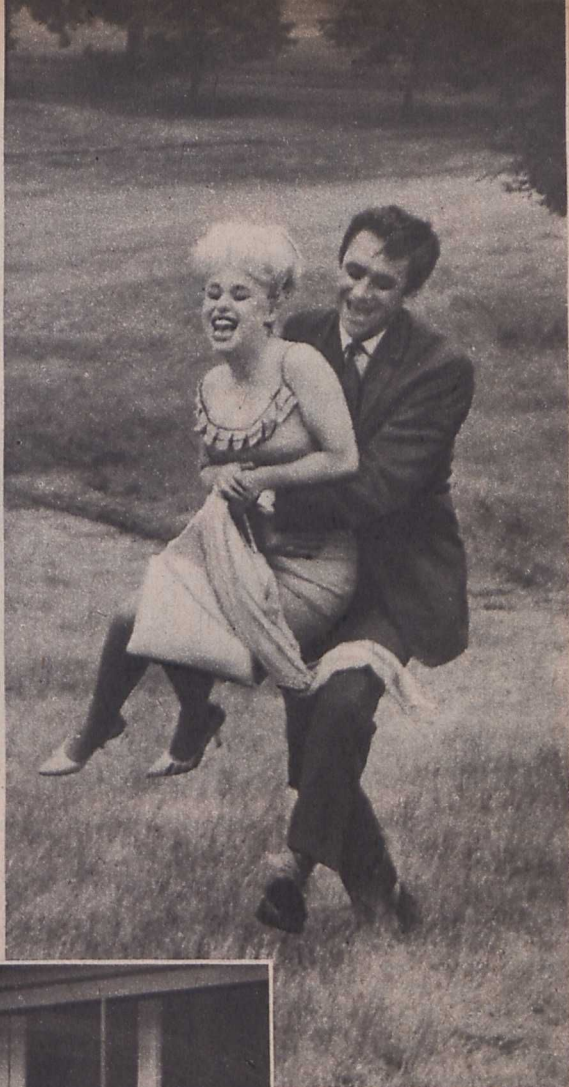
Barbara Windsor és James Booth

Kétségtől, régóta nem volt oly kiemelkedően jó angol vígjáték, mint »A verebek nem tudnak énekelni« című film. Ez Joan Little-