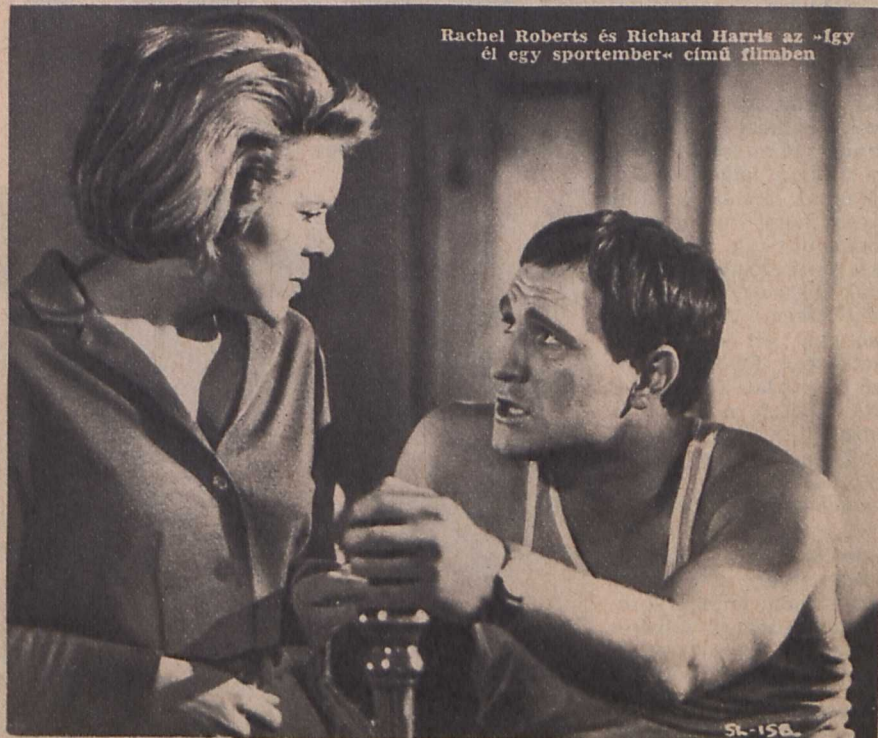
Rachel Roberts és Richard Harris az »Így él egy sportember« című filmben

Lehetséges-e az »élet vagy halál« kérdését humorosan feldolgozni? Stanley Kubrick amerikai filmrendező, aki a könyvből maga írta a forgatókönyvet, azon a véleményen van, hogy »a szatíra minden ékesszólásnál közvetlenebbül hat«.