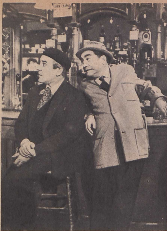
»A babaruhás ember.« Főszereplői: Tony Hancock és John Le Mesurier

rugby-játékossá lesz. De éppen brutalitása az, amely megakadályozza őt szerelmének elnyerésében, pedig erre vágya legjobban.