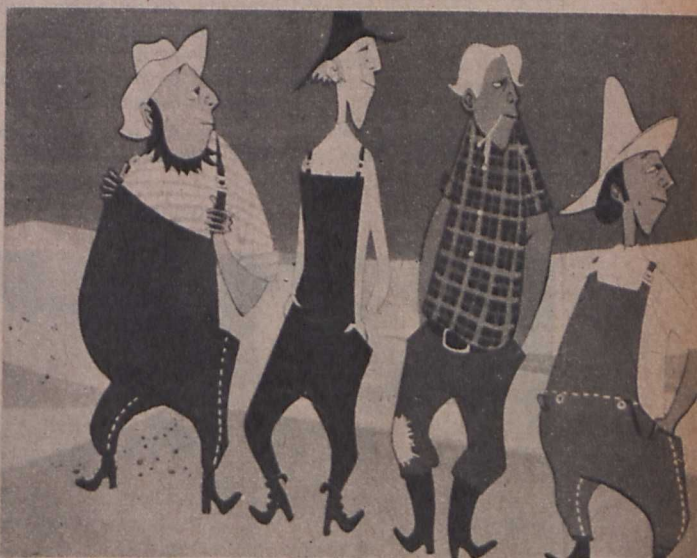
»Szobor a hajó orrán«

John Halas nevéhez fűződik az első brit bábfilm (»Szobor a hajó orrán«), az első hazai szte-