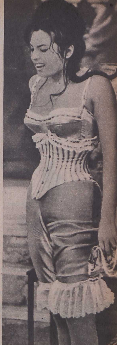
O. W. Fischer és Rosanna Schiaffino, az »Axel Munthe, a San Michele-i orvos« című film jelenetében

kítja. Heinz Rühmann, a hazánkban is jól ismert komikust újabban pap-szerepekre specializálták, egymás után játszatnak el vele olyan filmeket, amelyben ravasz lelkiatyákat alakít és rejtélyes bűnügyeket nyomoz ki. Több évtizedes hallgatás után ismét visszatért a műterembe Elisabeth Bergner, anya-