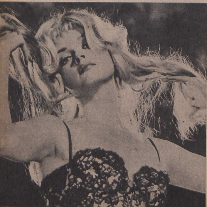
Nadja Tiller a »Lulu« című Rolf Thiele-filmben