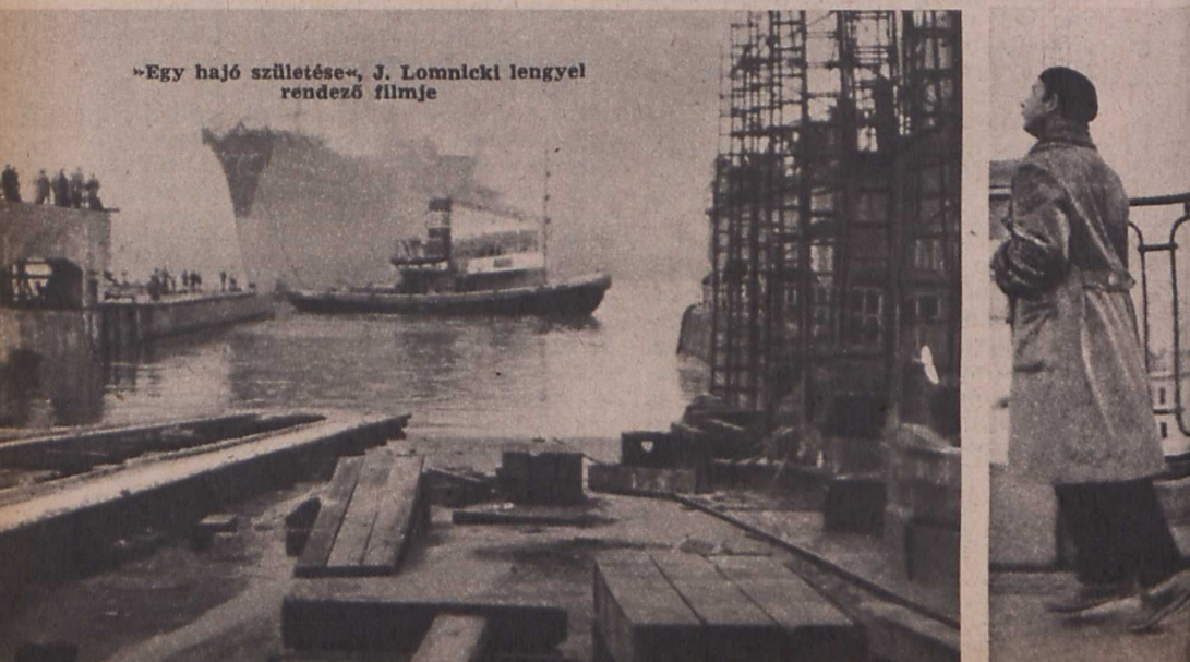
»Egy hajó születése«, J. Lomnicki lengyel rendező filmje

Végeredményben is milyenféle változás megfigyelésére nyílt alkalmam az elmúlt esztendőök rövidfilmjeinek áttekintésével?