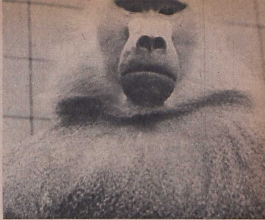
Két kép az »Állatkert«-ből. Bert Haanstra alkotása

Két éve Oberhausenben már bőven érződött annak a folyamatnak a hatása, hogy a rövidfilm mind véglegesebben a filmművészet tényleges műfajává válik, ismeretterjesztő, effektív dokumentáló karaktere mindinkább háttérbe szorul, gyakran teljesen eltűnik, s a félreismertetetlen esztétikum válik fő jellemzőjévé. (Természetesen mindörökké megmarad a filmnek egy rögzítő, dokumentáló jelentősége is — ez azonban most nem tartozik ide. Mégis, a legjelentősebb filmek akkor még erősen magukon viselték a tárgyilagosságot illusztrálás jegyeit — a »szép«-nek, az érzelmi megfogásnak, a művészi meglepetésnek a vonásai tán valamennyire másodlagosnak voltak mondhatók.) Persze, itt sem abszolútumokról, inkább jellemző arányokról beszélünk. A francia Jean Herman »Actua-Tilt«-je, a lengyel