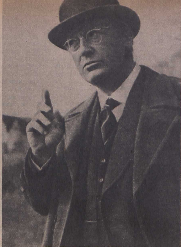
Curd Jürgens, Emil Jannings hajdani szerepében

Landru története és legendája mindenestre emellett tanúskodik. S emellett az az immár nemcsak a női nem részéről megmutatkozó elnéző érdeklődés, amely Françoise Sagan és