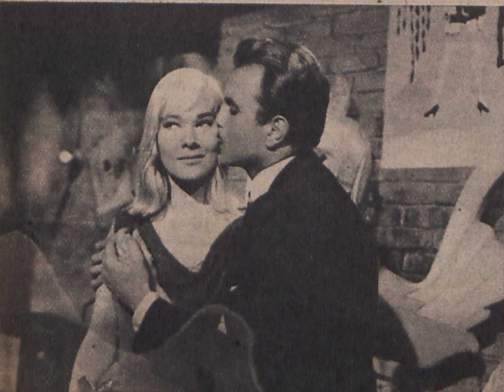
A »Kék angyal«

kel mindig rendkívül udvarias. Volt egy szerény kis háza Párizs környékén, ahová elvitte meghódított szerelmeit, hogy »jó levegőt szívjanak«. Különös véletlen folytán, a meghívottak sorra