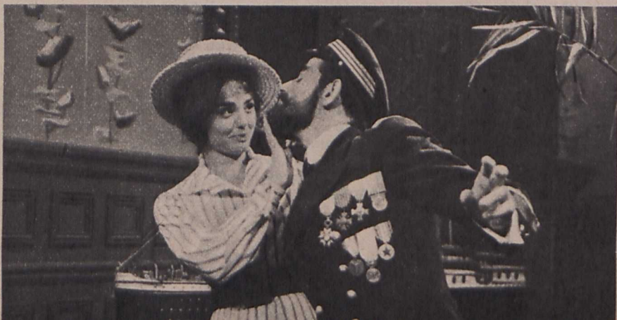
Jelenet a »Landru«-ból