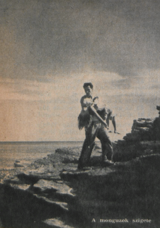
A monguzok szigete

Annyi azonban bizonyos, hogy Oberhausen leckéje erős; és hatásában bizonyosan pozitív. Új utak keresésére, a tartalmi és formai problémák újszerű, az eddiginél művészebb és hatásosabb megoldására sarkallja a kisfilmek művészeit. A Budapest Filmstúdió rendezői, operatőrjei, dramaturgjai fölemlítik a szűkös anyagi lehetőségeket. Annyi bizonyos, hogy esetenként sok mulhat ugyan a pénzen, de nemcsak itt van a problémák gyökere. Az is nyilvánvaló, hogy a kisfilm-művészek ambíciója előbb-utóbb megkopik abban az elég általános visszhangtalanságban, amely még jelentős műveiket is fogadja. A művészek telve vannak a forgalmazási szervek elleni kifogásokkal. Kevésnek tartják a kópiák számát, nem értik, miért kell titokban vetíteni a kisfilmeket, kritika alig szól róluk, plakáton sehol sem hirdetik műveiket. Szeretnék, ha megszületne valami olyasfajta rendelkezés, amely kötelezővé tenné vagy premizálhatná a mozikban a kisfilmek vetítését. Tény az, hogy a kisfilmek gazdasági rentabilitását kimutatni nem lehet; a helyáratat a