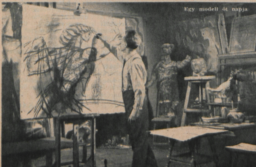
Egy modell öt napja

Az Oberhausenben néhány hónappal ezelőtt lezajlott Nemzetközi Kisfilm-fesztiválon a magyar filmművészet alkotásai közül egyetlen egyet sem díjazott a zsűri. A fesztivál növekvő tekintélye és nyilvánvaló pártatlansága csak fokozta a kudarc keserűségét, a beszámoló és a tudósítások pedig szinte teljes egyöntetűséggel állapították meg a magyar kisfilmgyártás színvonalának hanyatlását. De ha az oberhauseni