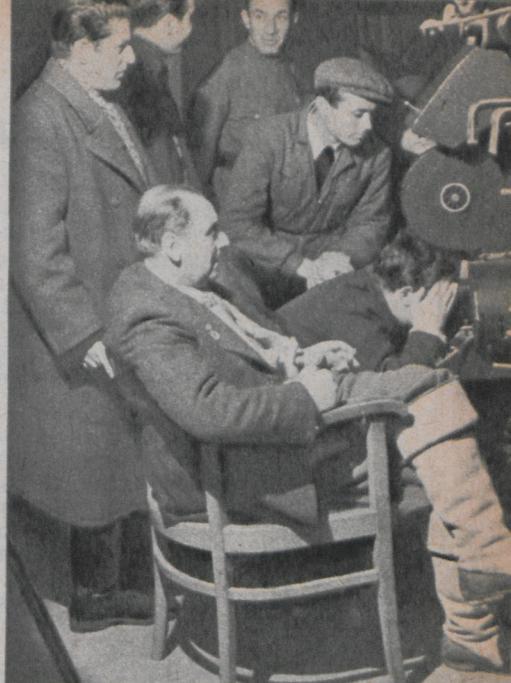
Vladimir Petrov az új szovjet-bolgár koprodukción, az »Előeste« rendezője

lehetővé tette, hogy a nagyok gondosabban, alaposabban készülhessenek elő új feladataikra. Így már érthető, miért nem találkoztunk — hogy csak néhány nevet említsünk — ebben az esztendőben például Grigorij Alekszandrov, Mihail Romm, Juliusz Rajzmann, Fridrih Ermiler, Abram Room nevével. Mihail Csaurelli Tbiliszi-ben »A nép leánya« című új filmjét készíti elő.