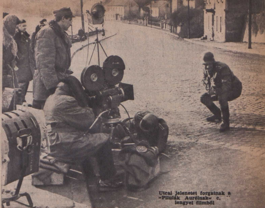
Utcán jelenetet forgatnak a „Pillulák Aurélnak” c. lengyel filmből

gatója Czeslaw Petelski is, a közönség között nagy népszerűségnek örvendő „Hajóroncs” című szenzációs film alkotója.