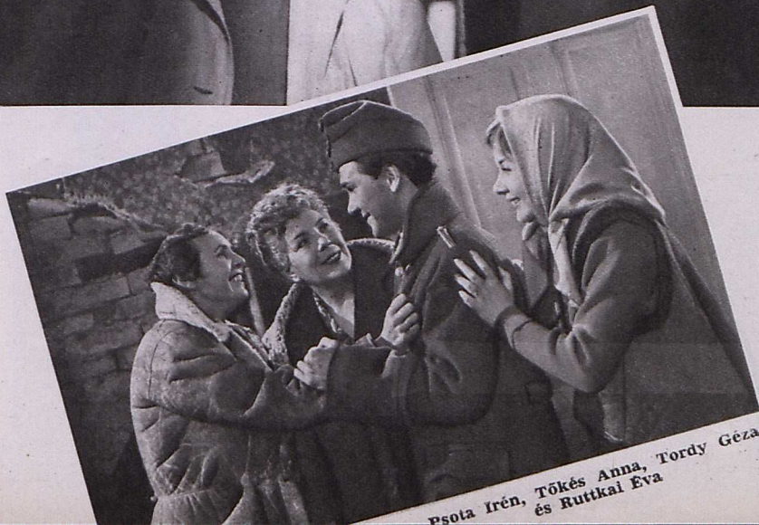
Psota Irén, Tökés Anna, Tordy Geza és Ruttkai Éva