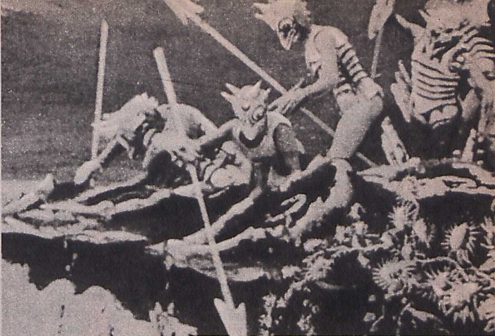
Méliès-nek, a film úttörőjének fantasztikus filmalkotása 1902-ből. Címe: »Utazás a holdba«

Georges Méliès filmjeinek nagy többsége már nem filmhíradó volt és nem természetes felvétel, hanem játékfilm, színészsereplőkkel. De kerek mesét csak a ké-