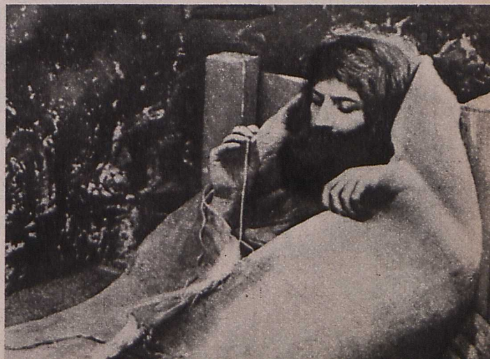
A »Gróf Monte Cristo« — ahogy 1918-ban képzeik