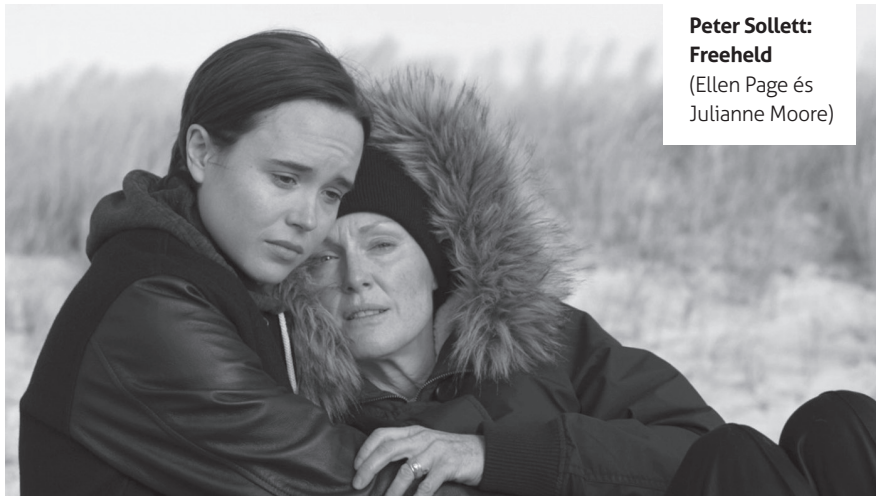
Peter Sollett: Freeheld (Ellen Page és Julianne Moore)

Laurel Hester harca és a 2006-ban meghozott pozitív döntés meghatározó lépés volt az egyenmű házasságok törvényi elismeréséhez vezető úton. Fontos tehát a téma és nem véletlenül bukkan fel számos nagy név a vásznon, a Freeheld nem váltja be a hozzá fűzött reményeket. Az alkotóknak nem sikerül átélhetővé varázsolni a drámát és sajnos a kínálkozó klisé-