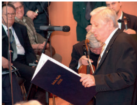
A szerzői szavakba öntött gondolatai

Nem szántam másnak, mint őszinte ajándéknak ezt a művet a keleti végvárok védel- mezőinek. Igaz, minden mo- dern mű manapság könnyen büntetéssé válik. Ez főleg a szo- katlanságuknak köszönhető! Én hiszek abban, amit leírok, az igazában, s üzenetében is. Épp ezért vállalom a dirigálá- sát is. De nem hiúságból 77-ik évemben, magamat nem csak megismertem, de bőven meg is