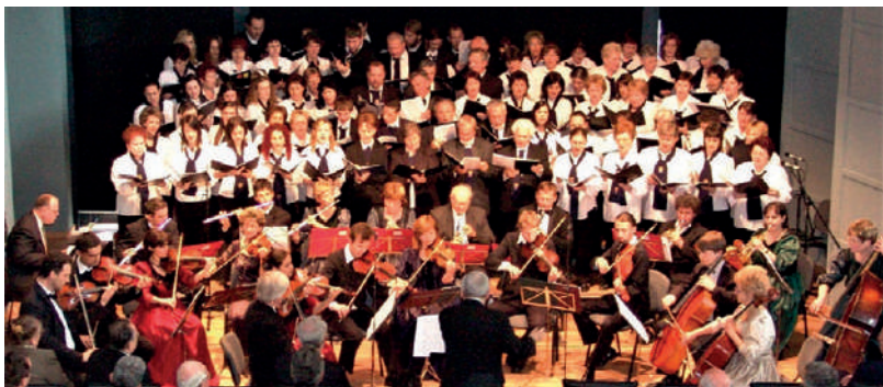
Az előadók: Lavotta János Kamarazenekar, valamint Zemplén Egyesített Vegyeskara