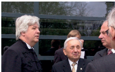
Szokolay Sándor balján Kazinczy Ferenc