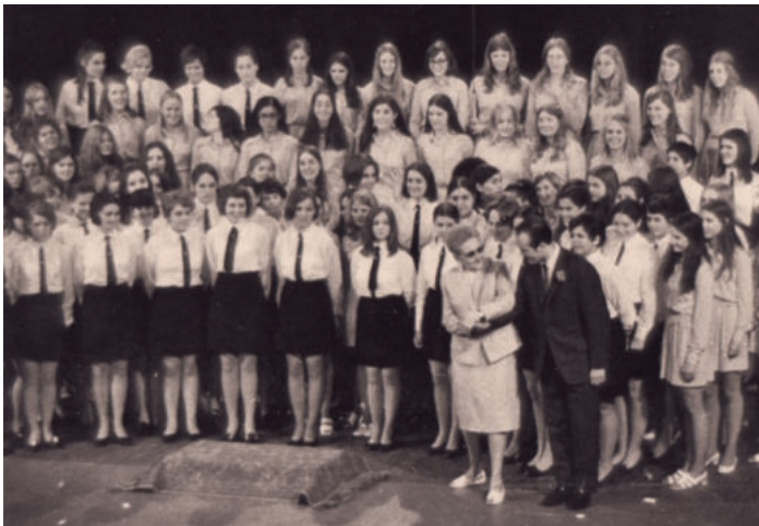
A két kórus és karvezetők