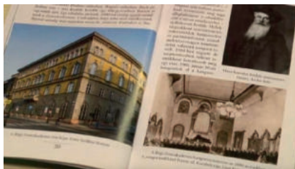
Kodály Zoltán nyomában Budapesten

képeletben ellátogatnának Kodály Zoltán budapesti életének és munkásságának helyszíneire. A helyszínek között számos olyan épület akad, ahová Kodály nélkül is elmenne az érdeklődő zenebarát olvasó vagy turista, de így talán többet tud meg a magyar zeneszerző, népzenekutató és zenepedagógus kötődéseiről is ” – olvasható a fülszövegben.