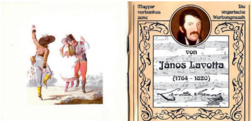
A Lavotta János Kamarazenekar első és máig egyetlen Lavotta-CD borítója (1995)