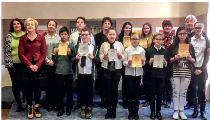
Népdaléneklési verseny díjazottai

Művészeti Iskola zongora tanszaka felkarolta azt az igazgatói kezdeményezést, hogy növendék ne fejezhesse be tanulmányait anélkül, hogy Erkel zongoradarabját – tetszőlegesen megválasztott letétben – ne tudja eljátszani. A zongoraverseny anyaga még egy huszadik századi, vagy kortárs magyar zeneszerző műve.