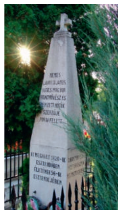
Lavotta János síremléke Tállyán

LAVOTTÁTÓL KODÁLYIG. Zempléni konferenciák a verbunkos zenéről (1990–2020). Könyvbeutató (a sátoraljaújhelyit követően a fővárosban is, a Lavotta János Kamarazenekar hangversenyével – várhatóan 2021 első félévében)