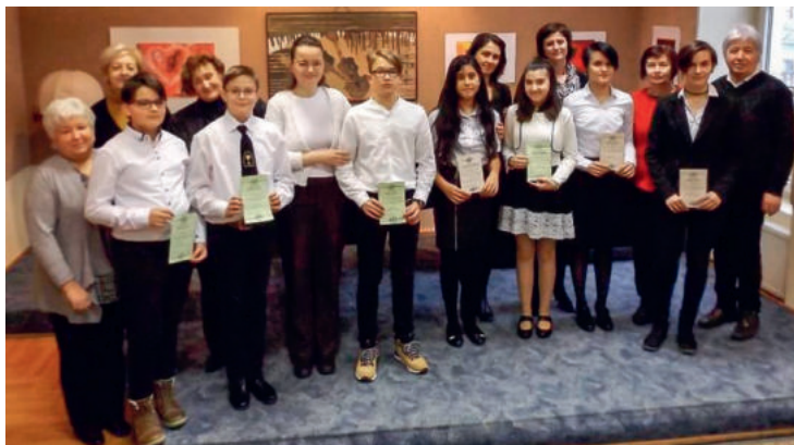
Himnusz zongoraverseny díjazottai

Művészeti Iskola zongora tanszaka felkarolta azt az igazgatói kezdeményezést, hogy növendék ne fejezhesse be tanulmányait anélkül, hogy Erkel zongoradarabját – tetszőlegesen megválasztott letétben – ne tudja eljátszani. A zongoraverseny anyaga még egy huszadik századi, vagy kortárs magyar zeneszerző műve.