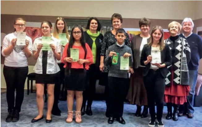
Szózat-éneklő verseny díjazottai

nagyon érdekes dolog, Lavotta, aki itt halt meg Zemplénben, Tállyán. Van egy csodálatos zeneiskolai igazgató, akivel fogunk találkozni, és nem tudom, hogy elmondja-e, mindenesetre én már itt elmondom: Himnusz-zongoraversenyt is rendeznek. Tehát az, hogy a zeneiskolában meg kell tanulni a Himnuszt, ehhez azt teszem hozzá: mindenkinek meg kellene tanulni énekelni is, mert olyat ne halljunk, hogy „most hallgassuk meg a Himnuszt!”... Lavotta, verbunkos, – a verbunkos zene ihlette Erkel Ferencet – Himnusz, Szózat... Ezek a dolgok mélyen összefüggenek, és benne ülnek a tájban, mint ahogy a tokaji bor is...”