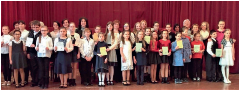
Regionális Verbunkos Négykezes Zongoraverseny díjazottai