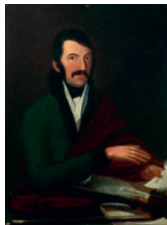
Lavotta János (1764–1820)

(F-dúr), Magyar Aquadro, Lassú Magyar (Homoródi, ezúttal hegedű-brácsa duóban), valamint Bihari Kesergője (Lavotta sírjára) – mind a Lavotta János Kamarazenekar Magyar Verbunkos Zene sorozatának CD-jéről hangzottak el. Lavotta János ilyen nyilvánosságot a három évtized alatt még nem kapott, pedig volt 12 zenetudományi konferencia és egy 250. születési évforduló is Sátoraljaújhelyen, Széphalmon és Tállyán... Ehhez egy olyan felkészült szerkesztő-műsorvezető, az Évfordulók méltó gazdája kellett, mint amilyen a rokonszenves Becze Szilvia.