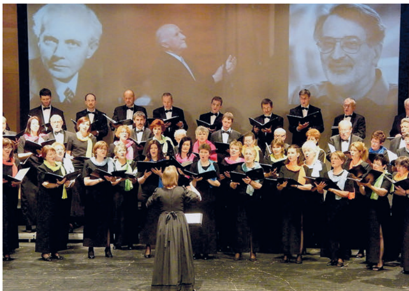
Bartók, Daróci Bárdos Tamás, Orbán György

Végül az erdélyi születésű komponista Orbán György egészen új feldolgozását hallhatjuk, a régi, kedvelt népdalhoz: Tavaszi szél vizet áraszt . Zongorán közreműködik: Józsa Eleonóra .