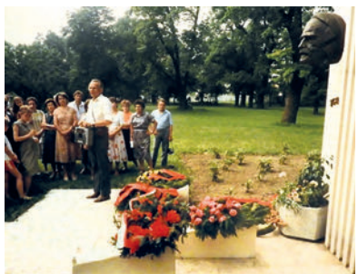
Galántai Kodály Napok (1987)

Több évtized tevékenységét nem lehet részletesen áttekinteni, csak néhányat emelek ki az általa megtervezett és megvalósított több száz évfordulós megemlékezésből: