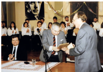
Tagcsoportunk 10. „születésnapja”