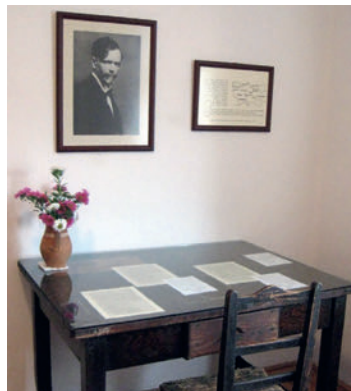
A parókian található asztal, amelyen Kodály lejegyezte a dallamokat.