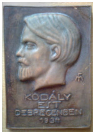
A terrakottából készült plakett az iskola tulajdona

A Református Kollégium 400 éves fennállásának jubileumi ünnepségén, 1939. május 14-én, első ízben hangzott el Debrecenben a Psalmus Hungaricus . A főpróba karnagya Kodály Zoltán volt. Az ünnepségen betege miatt nem tudott megjelenni, a következő sorokat küldte: