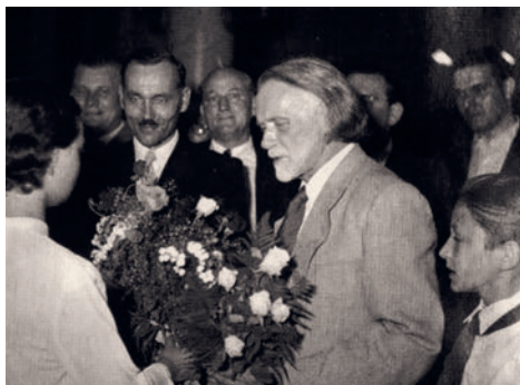
Kodály Zoltán a debreceni zeneművészeti szakiskola névadásán 1957. június 23. [A képen, Kodály Zoltán mögött Pongrácz Zoltán, Gulyás György és mások]

„Tebát azért egyeztem bele, utóvégre, hogy nevemről nevezzék el ezt az iskolát, mert látszott valami biztosítéka, hogy az egészséges zenekultúrára való nevelés itten jó otthonra talál, biztos kezekre van bízva...” mondta avatóbeszédében Kodály Zoltán.