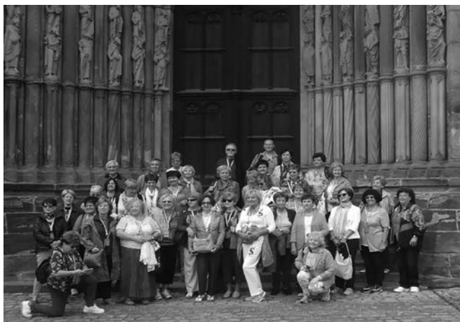
A csoport egy része a dóm bélletes kapujánál

délre, az Inn folyó partján megépített Neuburg vára, valamint fél Tirol, Dalmácia, Isztria és két burgund grófság is.