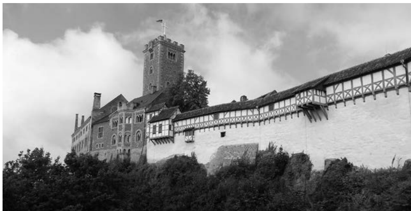
Wartburg vára - 1999-től az UNESCO Kulturális Világörökség része

A várkastély pompás dísztermei közül kiemelkedik az Énekesek csarnoka (mely a híres középkori dalverseny emlékére készült), és az a szoba, ahol gyönyörű mozaikok mesélik el Szent Erzsébet életét. Láttuk a Luther szobát is, ahol Luther Márton 1521-ben németre fordította a Bibliát. Szállásunk a második éjjel Eisenachban volt.