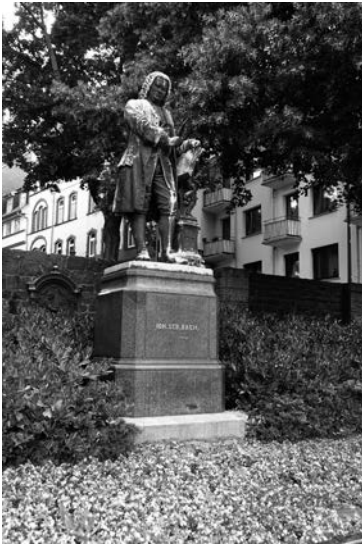
Eisenach J.S. Bach szobor

Természetes, ha Eisenachban járunk, nem maradhatott el, a Bachhaus látogatása sem, hiszen Johann Sebastian Bach itt született, és tíz évet töltött a városban. Csodálatos volt az a kis koncert, melyen 18. századi hangszereken játszott darabokat a csoportot fogadó kedves hölgy. A történelmi Bachhaus mellett az új épületben található múzeumot is meglátogattuk, ahol ki-ki kedvére hallgathatott csodálatos Bach muzsikát.