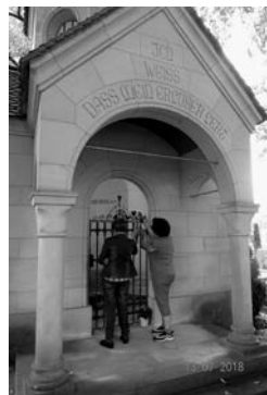
Liszt Sírkápolna – koszorúzás

A negyedik éjszakát ismét Nürnberg ben töltöttük, de előtte itt is városnézésen vettünk részt. Kár lett volna kihagyni, hiszen Nürnberg Németország lelegevőbb történelmi múzeuma. Lenyűgöző, izgalmas, felemelkedés és bukás között csapongó város. Észak-Bajorország legfontosabb gazdasági és kulturális központja.