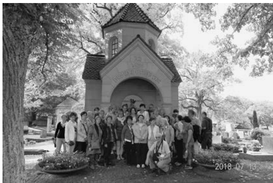
Liszt Sírkápolna – megemlékezés