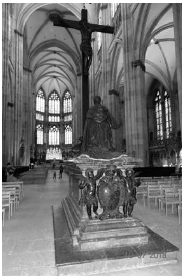
Regensburg-i Dóm belső képe

A katedrálisban állítólag 100 olyan kép és szobor található, melyen Szent Pétert ábrázolják, akinek a templomot is szentelték.