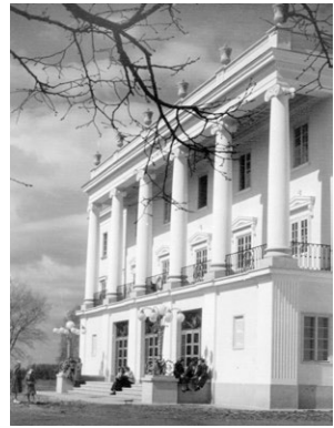
A Zenepavilon az átadás után

Merthogy Kodály is támogatta a folytatást, látta a külföldi és hazai érdeklődés kiteljesedését. Amikor veszélybe került a további működés, kiterjedt levelezésbe kezdett, még a pártközpontba is írt.