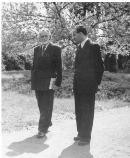
Kodály első látogatása 1950-ben