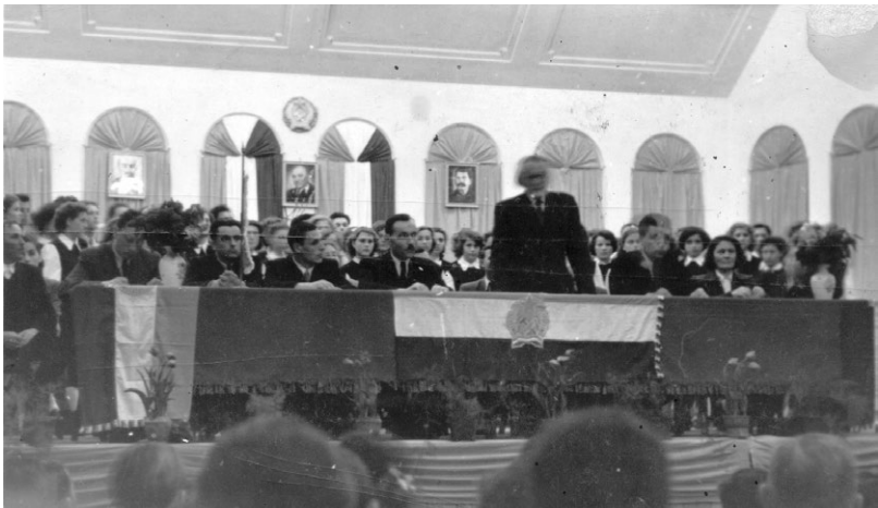
Kodály Zoltán avatóbeszédet mond a Zenepavilon átadási ünnepségén 1953. május 1-jén