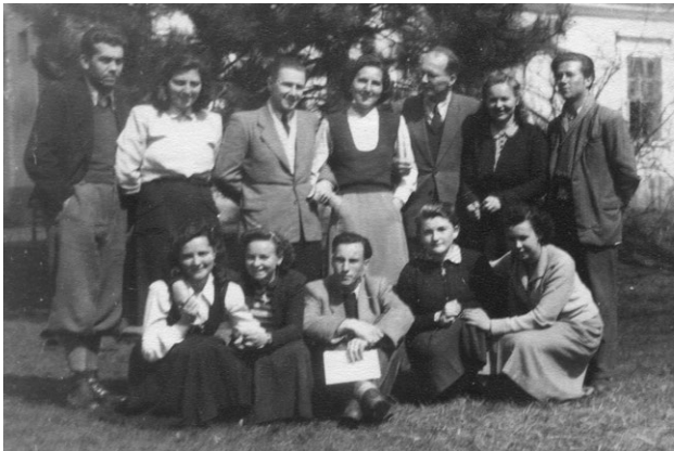
Tantestület az Énekiskola első éveiből

a gyerekeknek, villanyt szereltek, takarítottak- megtettek mindent, hogy növendékeiknek megteremtsek a legtöbbet, amit lehetett. És mind amellett továbbtanultak.” Pótolták a családot, hisz mindenki bentlakó volt. Majd a cikk szerzője - az ötvenes évek ideológiai elvárásainak megfelelően - a „szocialista nevelés követelményét” hangsúlyozva kiemeli a tarhosi iskola közösségteremtő erejét, valamint beszámol arról is, hogyan élnek a kollégiumban a diákok, hogyan nyilatkozott Novikov szovjet zeneszerző a Tarhoson látottakról.