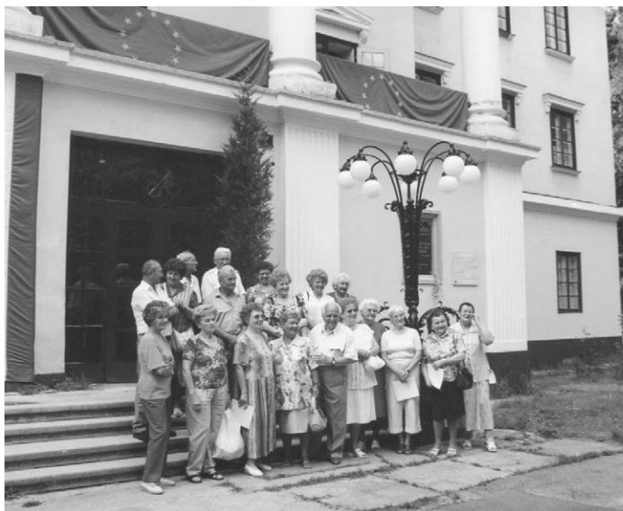
Pavilon előtt az egykori diákok az 50 éves találkozón

Lehetetlen vállalkozás lenne felsorolni a fellépő karnagyok, zenekarok, kamarazenekarok, szólisták nevét. Negyven éve számos világhírű és hazai művész előadásában gyönyörködhetett a hallgatóság. Néhány