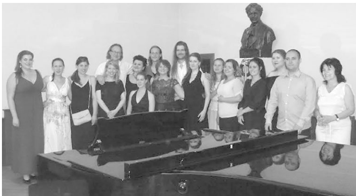
Szegedi kurzus résztvevői

Másik negatív tapasztalatom az internettel kapcsolatban azt mutatja, hogy a zenét tanulók egyre kevésbé olvasnak jól kottát. A diákok minél hamarabb szeretnék elsajátítani egy-egy darabot, s ehhez segítségül a youtube-ot hívják. „Etalon” felvételeket keresnek, lehetőleg sztár előadókkal, ahelyett, hogy kialakítanák saját elképzelésüket. Tehát fordított a tanulás sorrendje: a készen kapott előadásokat fül után memorizálják, s nem kottából tanulják meg. Ennek törvényszerű következménye, hogy egyre kevésbé tudnak blattolni. – Arról nem is beszélve, hogy nem ismerik az elméleti tantárgyak jelentőségét, azok gyakorlati hasznát, s nem tudnak szolmizálni.