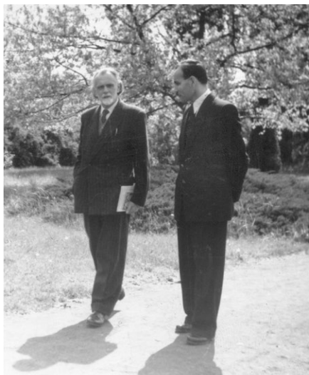
Kodály első látogatása 1950-ben