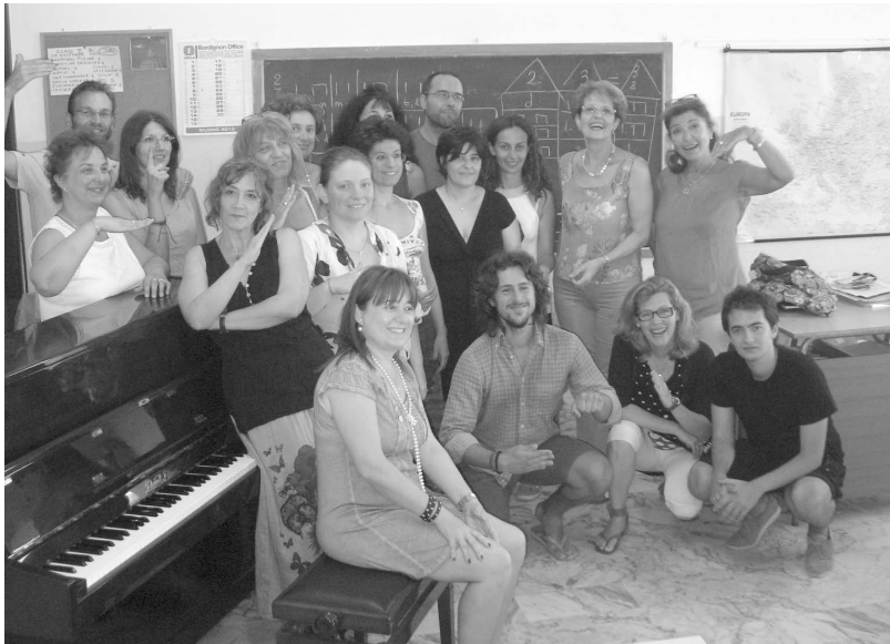
Marina di Pietrasanta