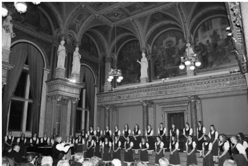
Cantemus Gyermekkar – Nyíregyháza, vezényelt: Szabó Dénes