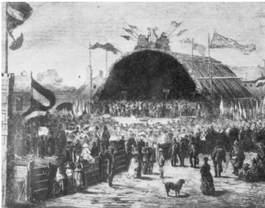
Debreceni dalosverseny, 1868. szeptember 25-én (Munkácsy Mihály rajza)