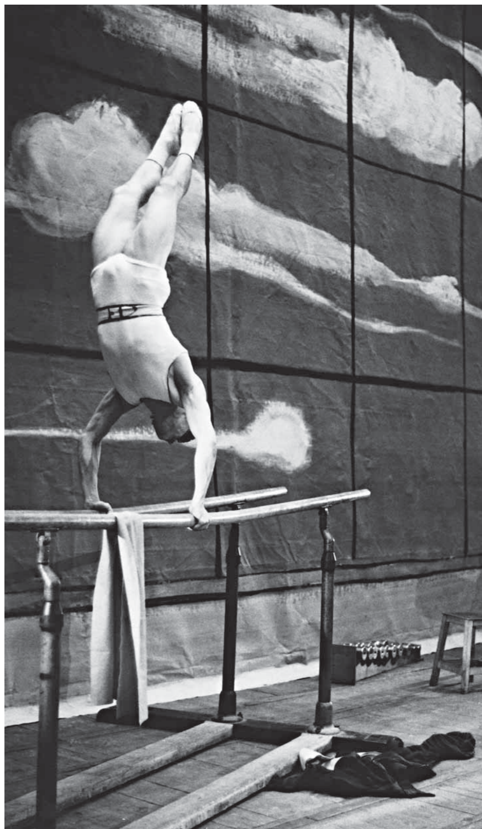
Jean Babilée: Balance à trois , 1955 / Jean Babilée