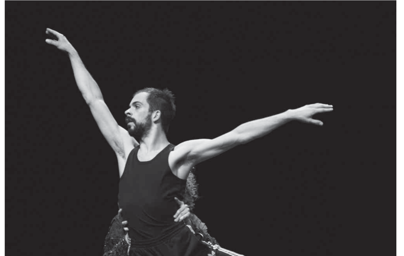
Molnár Csaba: Dekameron (2014)