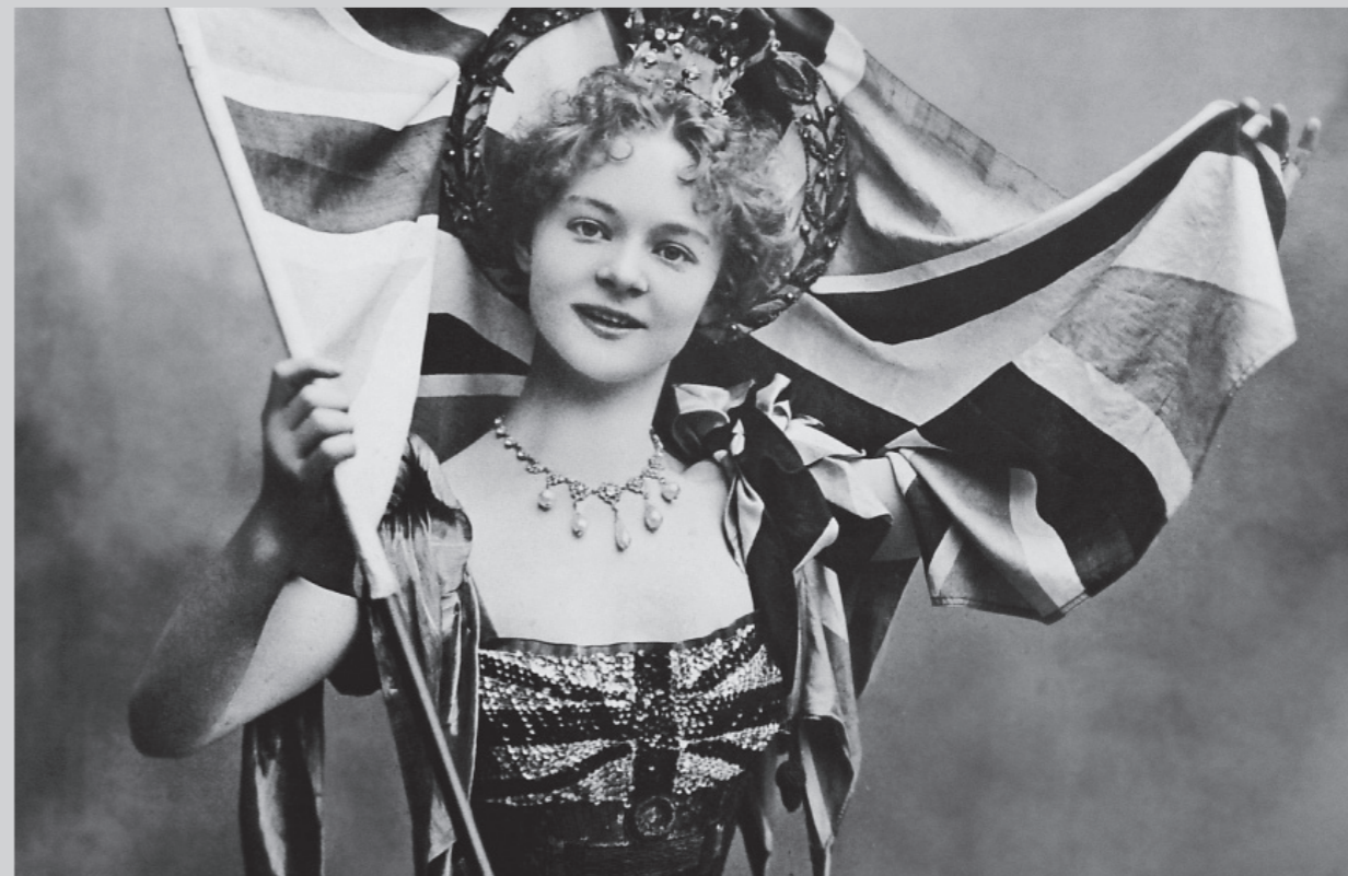
A fiatal Adelina Genée egy hazafias balettben (London, 1899).