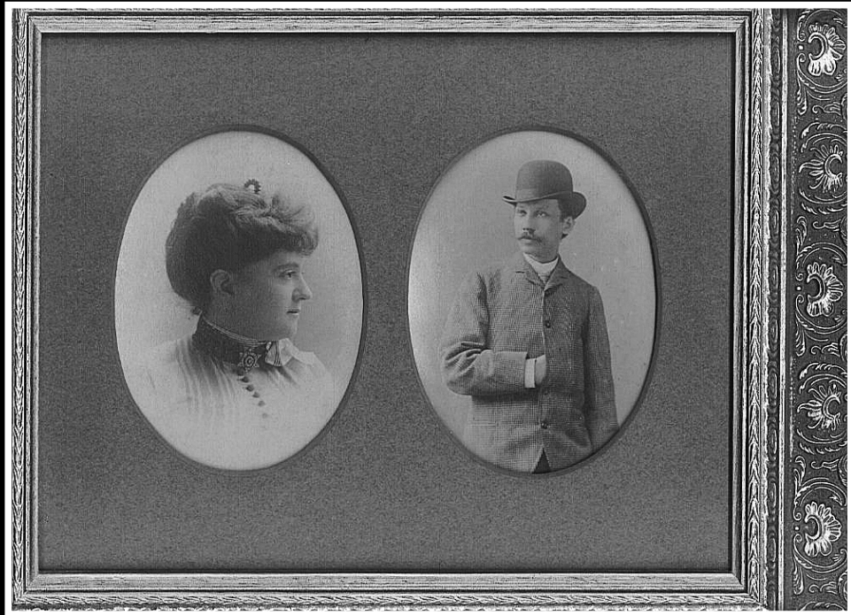
Királyfő Balázs (Bolossy Kiralfy) és első felesége, Elise Waldau - 1870-es évek.