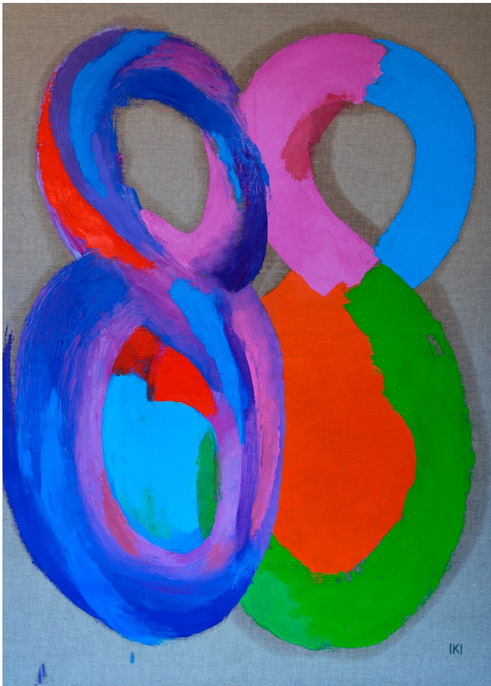
↑ Ilona KESERŰ Ilona: Nyolcvannyolc , 2021. november 21., olaj, vászon, 170×120 cm