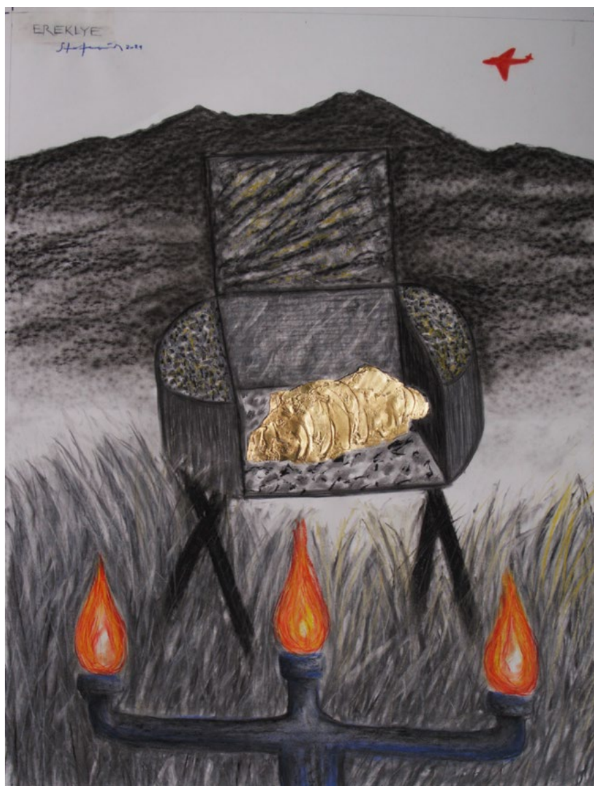
↑ STEFANOVITS Péter: Ereklye II. , 2021, szén, pasztell, 130×100 cm