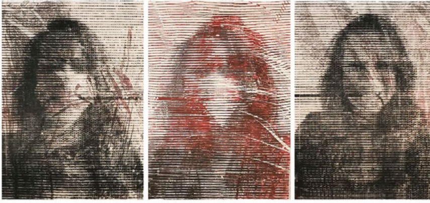
↑ KOVÁCS CSONGA Anikó: Deformációk (triptichon), 2021, linómetszet, vegyes technika, 100×70 cm A művész jóvoltából