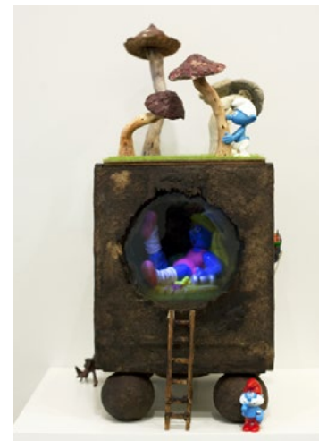
KARÁCSONYI László: Fel akarok nőni (törpkukkolda) , 2013, fa, nagyítólencse, műanyag, fém, LED, 20×15×35 cm

Ludwig Múzeum, 2022. október 14. – 2023. január 15.