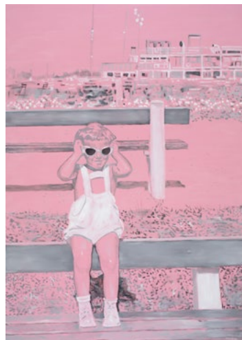
FEHÉR László: Padon , 2020, akril, olaj, vászon, 250×180 cm