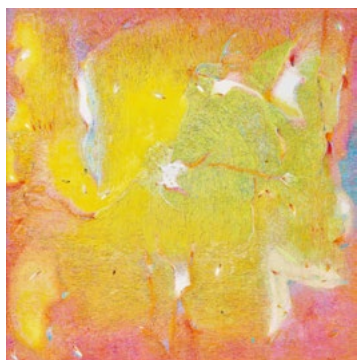
MOLNÁR Sándor: Sunjata, No. 11 , 2004

Műcsarnok, 2022. szeptember 30. – 2023. február 5.