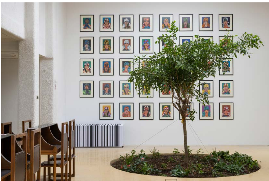
RomaMoMA Library, 2022 ←

Kié a város? – teszi fel a kérdést a Manifesta igazgatója, Hedwig Fijen bevezetőjének címében, 1 és utal a Manifesta 1990-es évek elején megfogalmazott céljaira, Európa kulturális topográfiájának és változó szerkezetének vizsgálatára. A Manifesta először választotta helyszínül a Nyugat-Balkánt, olyan helyet, ahol kultúrák és identitások folyamatosan (újra)formálódnak. A jelen krízishelyzethez, az orosz-ukrán konfliktushoz és háborúhoz a biennálé alkotói Koszovó múltbéli eseményeivel szólnak hozzá és pozicionálják újra a Manifestát radikális változást eszközölve munkamódszerükben: a felülről jövő intervenciók helyett a helyi közösségekkel részvételen alapuló gyakorlatot valósítanak meg, és nagy számban vonják be a koszovói művészeket a kiállításokba. 2 A demokratikus működési forma felé való nyitás a helyiek aktív bevonását és a biennálé száznapos nyitvatartási ideje után is működő kezdeményezések életben tartását, egyfajta városi katalizátor szerepet jelent. A közvet-