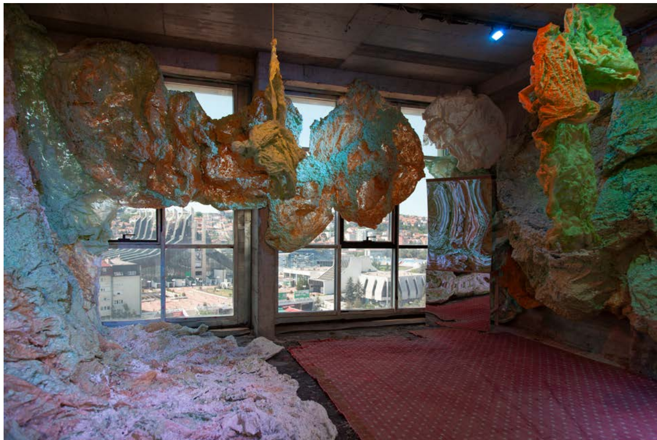
Seapussy Power Galore - Abcession (If you don't know, you don't grow), 2021-22 © Mette Sterre →

gia, a főváros és a spekuláció kulcsszavak köré rendeződik a kiállított anyag. A spekuláció tematikus egységében található Ladik Katalin Phonopoeticája (1976) vagy Mette Sterre Seapussy Power Galore - Abcession (2021-22) víz alatti, mozgó tájképe. A szeretet szekcióban a Pristinában élő Driton Selmani nejlonzacskókra írt szerelmeslevelei ( Love Letters , 2018) vagy Joseph Beuys Kéz akciójára (1968) is utaló kézfilm az albán Silvi Naçitól ( Actions that make my hands hurt , 2019) a banálist és a drámai kötik össze.