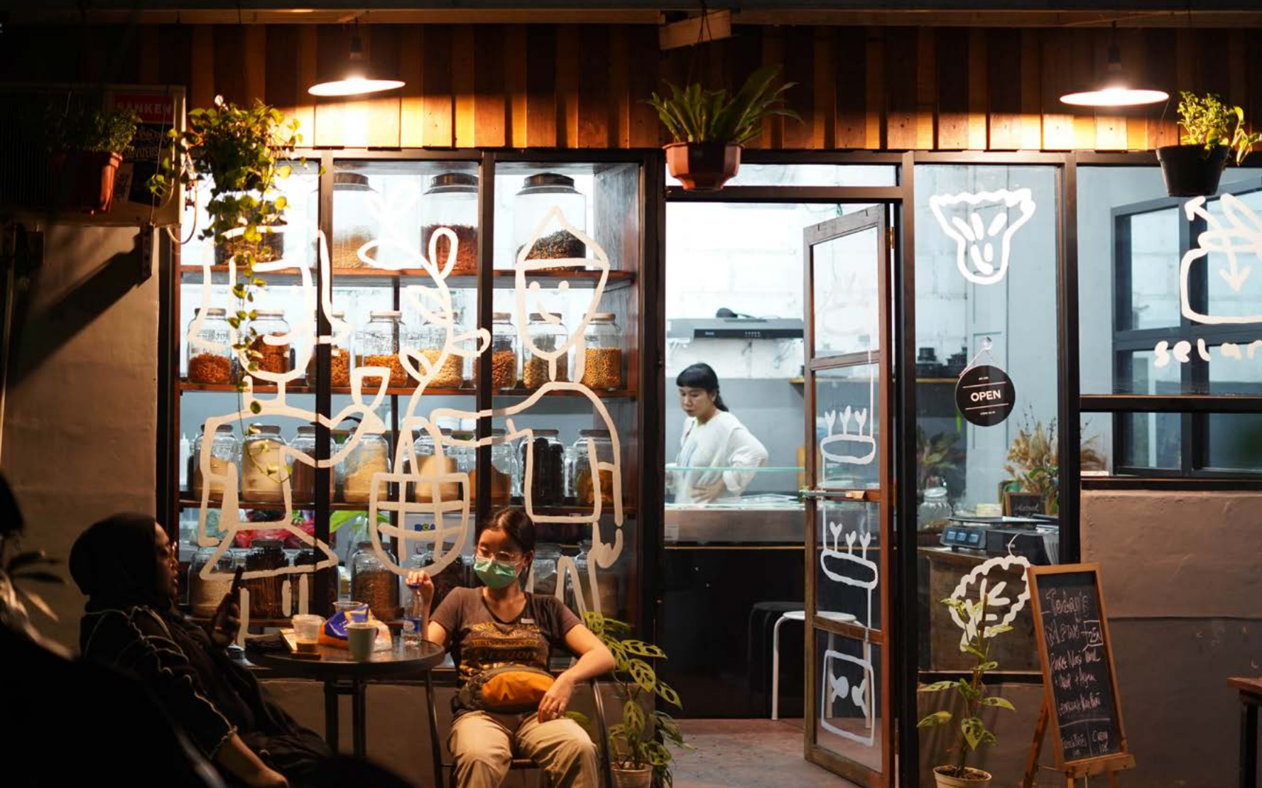
↑ Selarasa Foodlab, Gudskul, Jakarta

alkotócsoportjai számára is hozzáférhető az oktatás. Az aktuális évfolyam hallgatói minden tanév végén közös projektet hoznak létre, idén például a Jakarta Biennalén látható Ring Projectet , ami kiállítás formájában mutatta be a kollektívák együttműködésére épülő kutatási és alkotói projekteket.