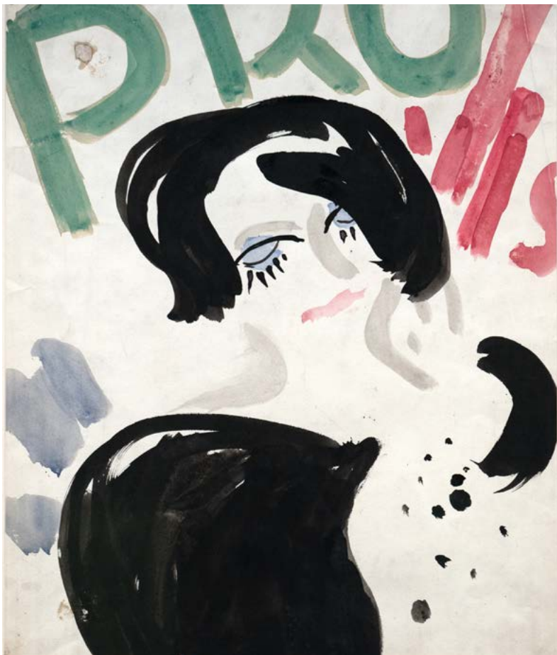
VASZARY János: Fekete hajú táncosnő , 1926, akvarell, tus, papír