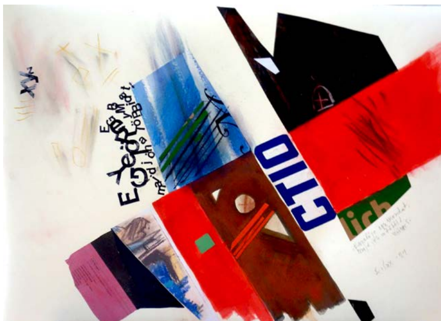
↑ LUX Antal: Egyelőre egy mondat , 2021, akril, kollázs, 50×70 cm A művész jóvoltából