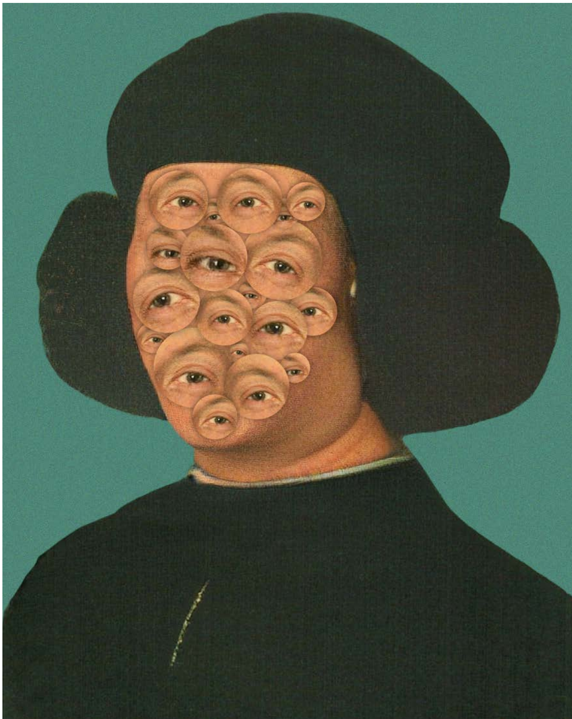
SZAUĐER Dávid: Elon, the renaissance man! , 2022, HD, animáció A művész jóvoltából ←

Matteostól származik a mondat. Számomra ez egy kicsit a futurista kiáltványhoz és Marinetti Óda a versenyautóhoz című verséhez hasonlatos.