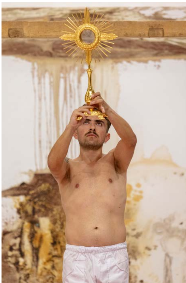
Hermann NITSCH: 158. akció, 2020. szeptember 18. Museo Archivio Laboratorio per le Arti Contemporanee Hermann Nitsch Naples ←

1971-ben Nitsch és felesége Prinzenhofban megvásárolt egy kastélyt a Weinviertel borvidék közepén, Bécsből északra, közel a szlovák határhoz. Attól kezdve mindmáig ott van az Orgia Misztérium Színház (OMT) állandó helyszíne. 1988 nyarán hat napig tartó ösztönművészeti OMT-előadást tartottak 500 résztvevővel, színesekkel, zenekarokkal, bontott marhákkal, báránnyal, sertésekkel és rengeteg vérral. A helyszín távol állt at-