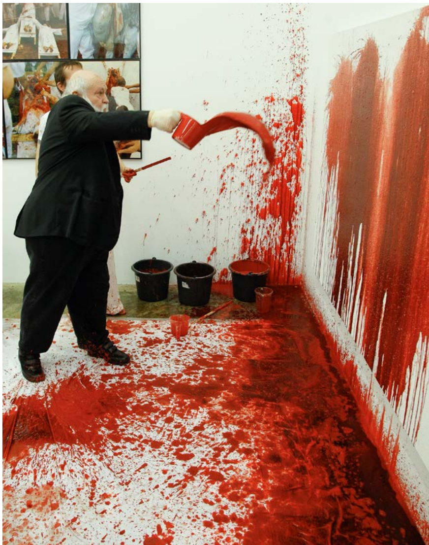
2009-es fénykép a művészről munka közben