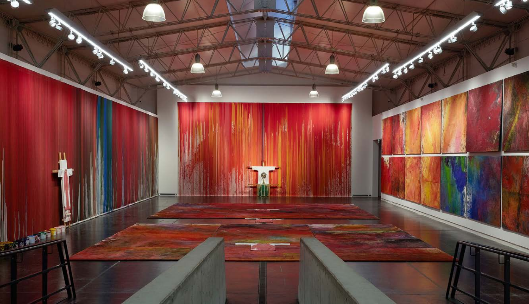
↑ Hermann NITSCH: Bayreuth – Walküre, kiállítási enteriőr, Nitsch Múzeum, Mistelbach 2021. X. 10. - 2022. IV. 9.

nem merete beengedni. Az informel és a tasizmus mellett erős hatást tett rá az action painting, és rájött, hogy táblakép helyett valódi eseményt akar létrehozni, amely rituáléként zajlik, és minden érzékünkre hat. A látvány nem elég, éreznünk kell a szagát, s ha lehet, izleljük meg és tapogassuk végig. Nem meglepő, hogy a misztikum felé hajló, szinesztéziát kutató Szkrjabint nevezte meg, amikor megkérdeztem tőle, ki a kedvenc zeneszerzője. Abban a bizonyos 1988-as évben rendezte meg Prinzenndorfban a hatnapos Orgia Misztérium Színházat, amit a visszatekintő és az életút egészét átlátó utókor a főművének tart. Korábbi elveihez később is hű maradt. Azt írta: „Akciófestézetem vászonfelületein a színházi akcióim vizuális grammatikája jelenik meg.”