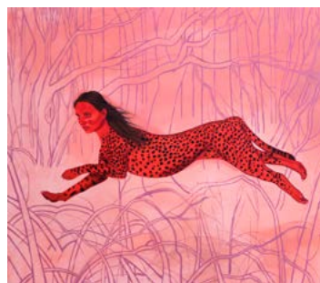
GALLAI Judit Ágnes: Nokturnális narratíva 1. , 2022, olaj, vászon, 140×160 cm

Pop-up kiállítások a Balaton-felvidéken Várudvar Galéria, Szigliget, 2022. június 27. – szeptember 30.