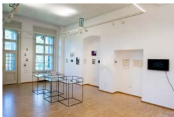
Kiállítási enteriőr, 2022

Regionális eszmecsere KEMKI, Artpool Művészetkutató Központ, 2022. május 10. – augusztus 19.