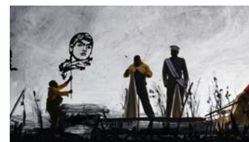
William KENTRIDGE: Lágyabban játszd a táncot , 2015, 15 perces, nyolccsatornás videóinstalláció

William Kentridge videóinstallációja NEO Kortárs Művészeti Tér, 2022. június 20. – október 2.