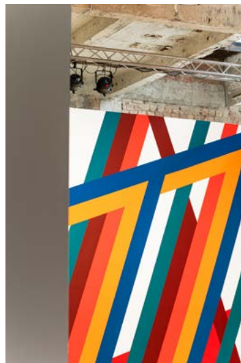
MAURER Dóra: Térfestés , 2022

Maurer Dóra kiállítása Torula Művészter, Győr, 2022. június 11. – július 30.