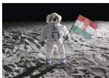
GERHES Gábor: Magyar Hold , 2011, fotó, c-print, lightbox, 70×90 cm Gerendai-gyűjtemény

Alternatív kozmoszok m21 Galéria, Pécs, 2022. május 28. – augusztus 28.