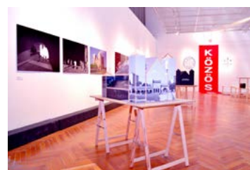
Kiállítási enteriőr, 2022

A top_OS csop_Ort első kiállítása Csók István Képtár, Székesfehérvár, 2022. június 10. – szeptember 25.