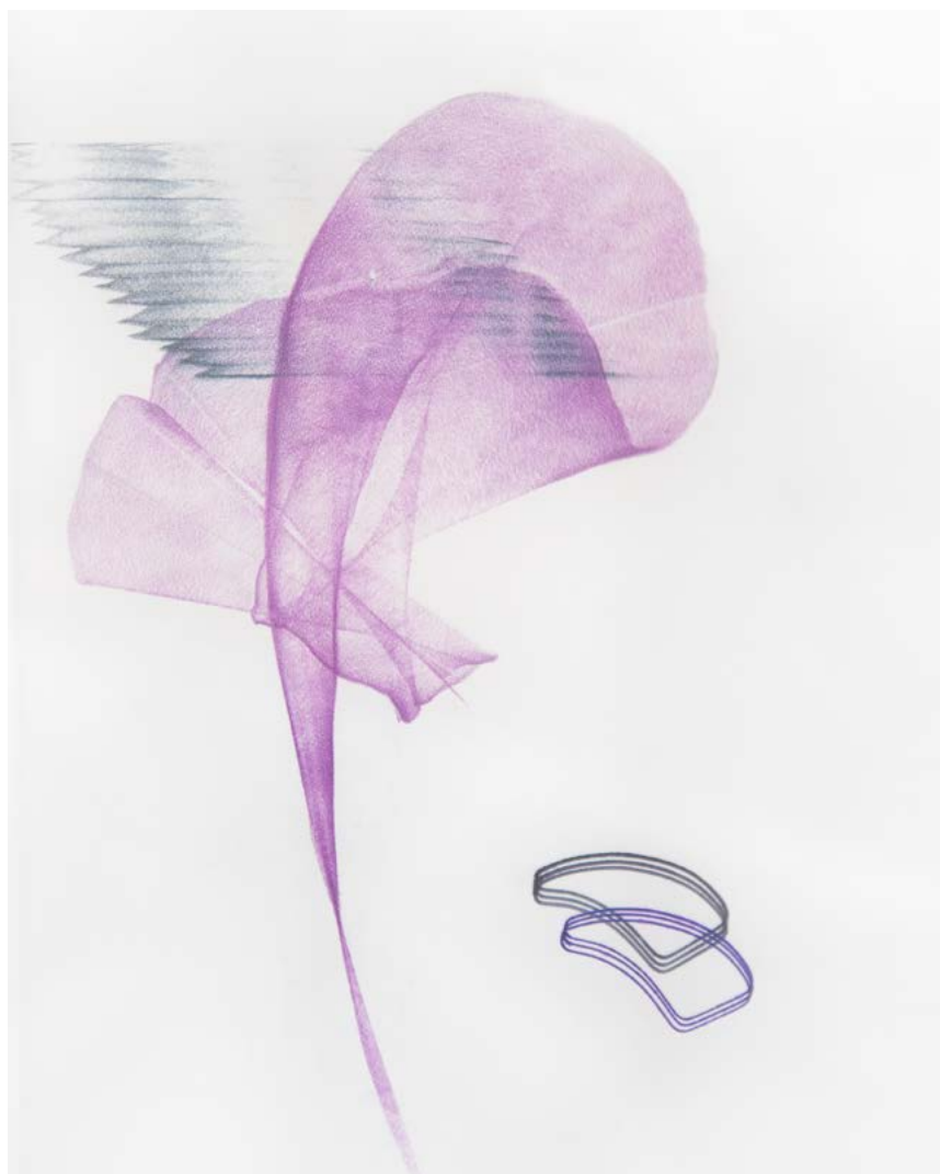
BARWANIETZ BEZERÉDY Melinda: Új élet , 2016, szén, pasztellkréta, papír, 70×50 cm ←

a grafikáig, a fotótól a videóig, az installációtól a konceptuális beavatkozásokig.” A kiállítás, ha kicsiben is, de felvillantja ezt a sokféleséget, a saját élmények és a családi emlékek beépítését munkáiba, melyet gyakran a címadások is elárulnak - Nagyapám szőlője , Találkozások - Családi délután a kertben . Ez utóbbiban az emlékezetből felbukkanó, elmosódott, lebegő figurák szubjektív telítettségük ellenére ismert toposzokat, képi motívumokat idéznek fel az Utolsó Vacsora drámájától az 1910-es évek magyar festészetében gyakran feltűnő, családi vagy baráti társaságot ábrázoló aranyorképekig.