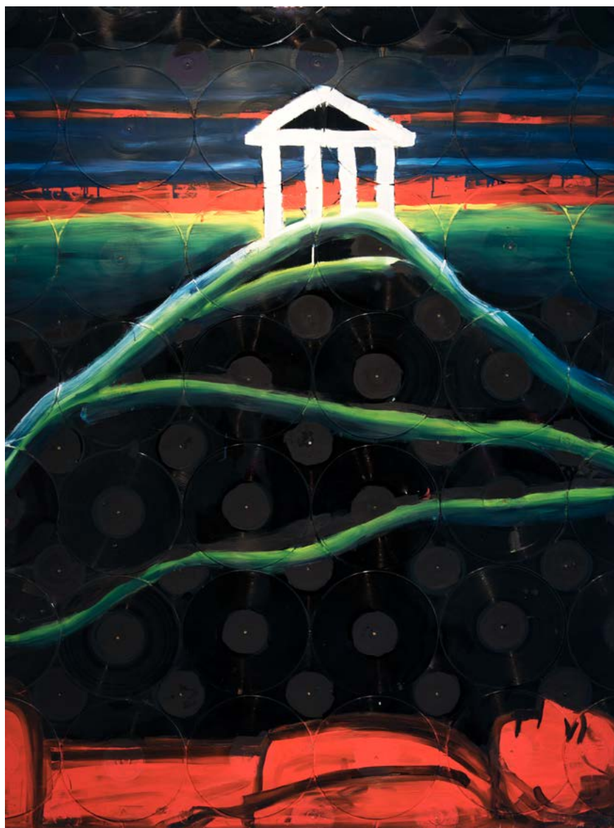
↑ KONCZ András: A Test halott/Tetszhalott, 1983–1985, olaj, vászon, vegyes technika, 200×150 cm

Az első tematikus blokk – mintegy felvezetésként – a posztkommunista rendszerekből fakadó politikai és történelmi reflexekkel foglalkozik. E témakört a történelmi tragédiákra, a holokausztra utaló válogatás követi többek között olyan alkotásokkal, mint Szűcs Attila már-már lírai és éppen ezért meghökkentő festménysorozata ( Lidice , 2003), illetve Zbigniew Libera legótéglákból és -figurákból épített, koncentrációs tábor formázó objektje. E felvezetés után magyar síkkonstruktivista festők vásznai következnek – Bak Imre: Dombok (1973) és Nádler István: Táj (1970) –, melyek nonfiguratívoknak mondhatók ugyan, ám címükkel, zöld, fehér, kék színvilágukkal a tájkép toposzát is megidézik. Mellettük jelen vannak a koncept art képviselői is – Erdély Miklós Időutazás I–III . (1976 körül) című, emblemikus, sokat reprodukált fotószorával és Szentjóby Tamás kis méretű, talán kevésbé ismert nyomtatásával, a Magyar verssel (1972). Koncz András transzavantgárd festményén, A Test halott (1983–85) című kompozíción egy bakelitlemezekkel borított dombon oszlopos, timpanonos görög templomot látni, közel a kerethez, a képtér alsó részén pedig egy figura hever. Az égbe emelt timpanonos szentély, valamint a földre bukott figura a korszak egyik szlogenjét idézi: „Az avantgárd halott.”