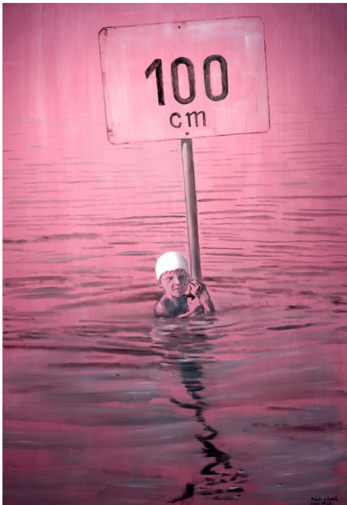
↑ FEHÉR László: 100 cm , 2020, akril, olaj, vászon, 180×120 cm HUNGART © 2022