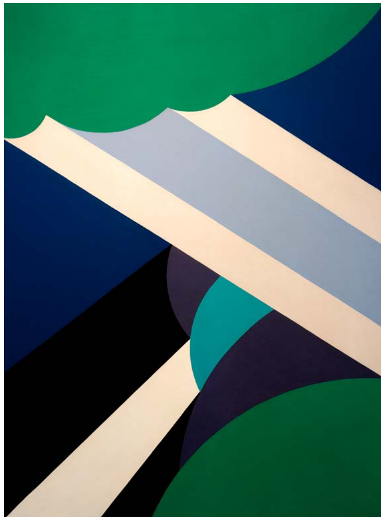
↑ NÁDLER István: Vence (Táj) , 1973, akril, vászon, 100×240 cm HUNGART © 2022

Fehér László két alkotással is szerepel a válogatásban. Egy korai, amatőr fényképek ihlette, komor, szürke tónusú csoportképpel ( Archív , 1978) és egy jóval későbbi, gyerekkori élmények alapján született, a strandon a víz mélységére figyelmeztető táblába kapaszkodó, fürdősapkás kislány megörökítő, rózsaszín koloritú festménnyel ( 100 cm , 2020). Vonzza a tekintetet az osztrák Erwin Wurm emberi lábakon álló, téglatestet formázó, groteszk Nagy dobozembere (2010). Ugyancsak a groteszk a fő jellemzője a Londonban élő lengyel képzőművész, Goshka Macuga híres emberek portréit, például Martin Heideggerét megidéző virágcserepeinek vagy Spoerri 90 fokkal a falra síkjára fordított – az asztalon felejtett tárgyakat, evőeszközöket, ételmaradékot, cigarettacsikkeket domborművé transzformáló – asszambulázsának ( Cím nélkül , 2011).