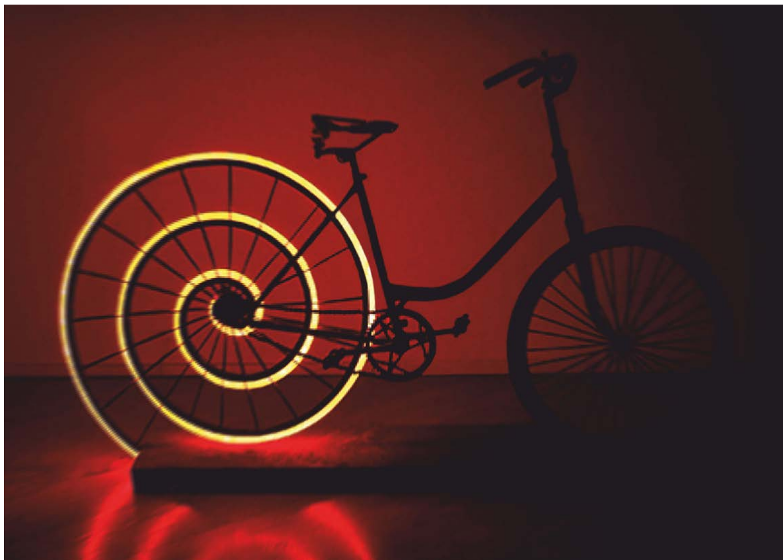
↑ HÉRICS Nándor: Végtelen út, flexibilis neon, kerékpár, 170×30×100 cm HUNGART © 2022

dő alakzata felel a nagyon is matériában formát öltött, szigorú gesztusok kemény idomaira. Máshol az anyagi dimenziók mellett megjelenő emberi aspektusok, konkrét helyek megidézése közelében végtelen horizontok, határtalan szellemi perspektívák sorakoznak a táblákon. A felejthetetlen momentumok meditációs objektummá válása épp úgy főszereplő, mint ahogyan az idő múlásának a toposzával is találkozunk. Feltűnik egy delejes, sziporkázó fényben alighogy megmártózó, éjszakai műterem magánya, melyre a fény várásának lüktető, hullámzó, pulzáló, rituális beavatása, az elemek (tűz és víz) egymást kergető, lüktető ellenpontozása válaszol. Tovább lépve, újabb alkotások előtt megállapíthatjuk, hogy a létezés határainak – makro- és mikrokozmoszok – keresése, a lent és a fent által értelmezett mennyei konstellációk alkímiájának rendje, szintén kompozíciós elvvé válnak.