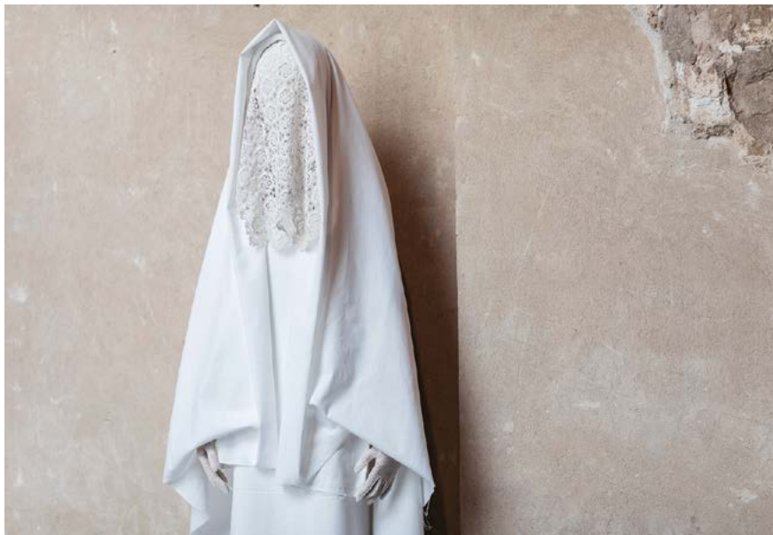
← JAKAB Borbála Róza: Fehér figura, 2020, installáció, rajzok, fénymásolatok, digitális printek

Jakab Borbála Róza családtörténeti önkutatást tárgyi asszemblázsokba fordító műciklusa Amphora és Egberts dohánnyal, pávatollakkal és kommunista relikviákkal tarkított gyűjteményeket szervez ambivalens egységekké. Művében az elbeszélte és elbeszéletlen történelmi múlt eltussolt momentumait jelképező objektumok közötti vonzást-taszítást emeli ki. Annamarija Gulbe szintén a kollektív traumák és egyéni tapasztalatok metszetét szcenírozta az összefirkált bútorlapokból összeállított reliefjével, amire különböző, személyes vonatkozású felvételeket vetített. Egy másik teremben Jakab Borbála Róza egy hófehér csipkelepel mögött rejtőzködő, zavarbaejtően néma alakot installált, mely a történelem kollektív lelkiismeretének allegorikus figurájaként