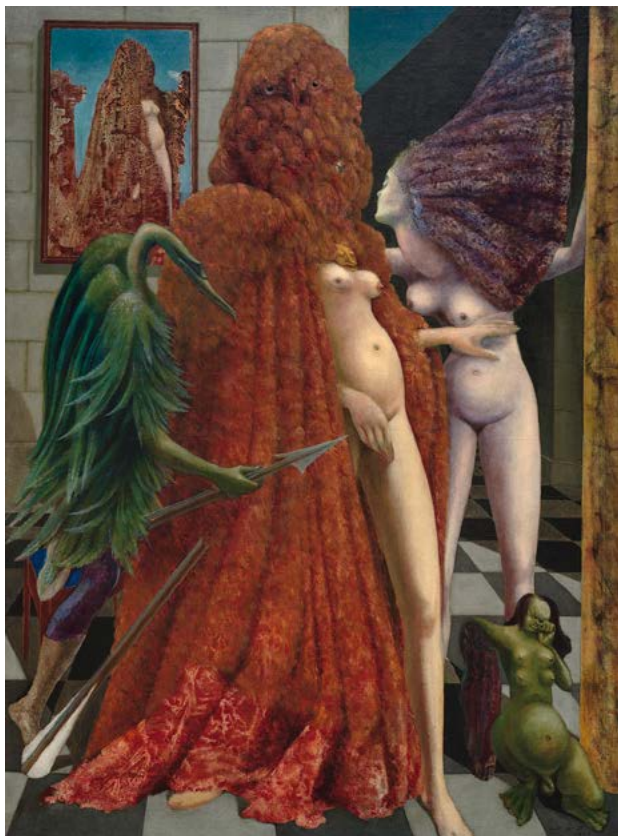
Max ERNST: A menyasszony öltözete, 1940, olaj, vászon, 129,6×96,3 cm Peggy Guggenheim Collection, Venice (Solomon R. Guggenheim Foundation, New York) © Max Ernst, by SIAE 2022 / HUNGART © 2022 →

netic art stb.) alapvetően egységes. A fennálló hatalmat, tekintélyt teszi idézőjelbe, a rendszerek felismert destabilitásával szemben alternatív, szabadon áramló, öntörvényű világokat mutat fel. Nagy természetességgel keveri a valóságot és a képzeletet, kiforgatja, életre kelti öntudatlan sejtéseinket, vágyainkat, félelmeinket. Olyan flexibilis, fluid, nyitott, központi idea köré építkezik, ami megzavarja, felülírja a mindennapi rutinunkat. Veszélye abban rejlik, hogy az antropomorf, biomorf, narratív realista ábrázolásmódja gyakran a giccs határán vagy azon belül helyezkedik el, ami egyébként ennek a gyakorlatnak és a biennálénak is gyenge pontja. Hatalmas