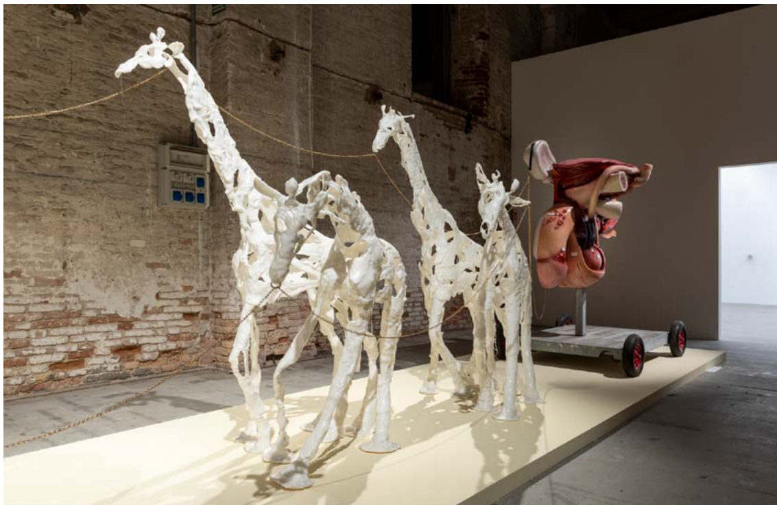
Raphaela VOGEL: Képesség és szükségszerűség, 2022, poliuretán, fém, anatómiai modell, 220×135×1030 cm HUNGART © 2022 ←

dolga, hogy megfordítja a nemek arányát, felülírja, a pálya szélére helyezi a férfiak által kanonizált múzeumi művészetet, idézőjelbe teszi a lomha, hierarchizált rendszert.