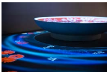
Kim Chang KYUM: Víz, Árnyék, Hold , 2021, vizes habarcs, egycsatornás videó, hang, 210×130×20 cm, 4' 21''

A koreai nemzeti identitás nyomában Koreai Kulturális Központ, 2022. július 29-ig