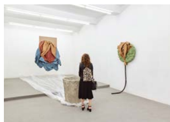
Kiállítási enteriőr, BALÁZS Nikolett: Szomjas kút , 2022, Artkartell projectspace, fotó: Biró Dávid

Artkartell projectspace, 2022. május 17. – június 12.