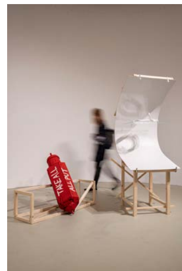
ERDŐS Zsófi: Amíg a cukor elolvad , 2022, installáció, változó méretek

Fészek Művészklub, 2022. május 18. – június 19.