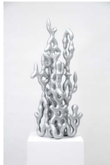
MELKOVICS Tamás: Alloy composition 12. , 2021

Csoportos kiállítás Q Contemporary Project Space, 2022. május 20. – június 25.